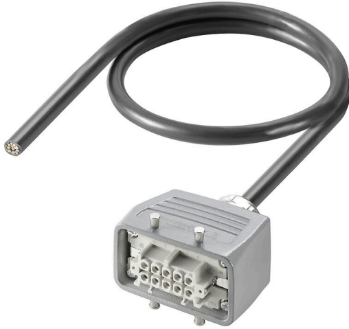
Product similar to illustration