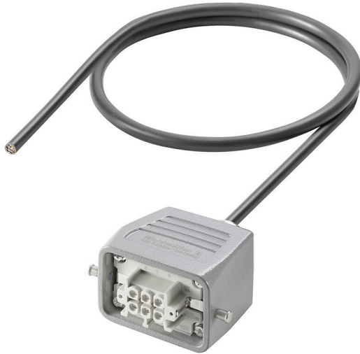
Product similar to the picture