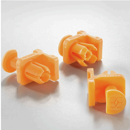
組立コストの削減 瞬時にセキュリティー確保