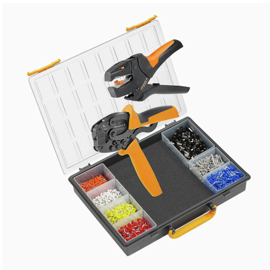
Set di crimpatura