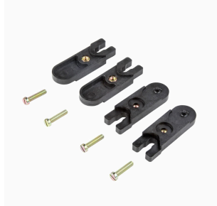
Staffe di fissaggio esterne Set di 4 pezzi