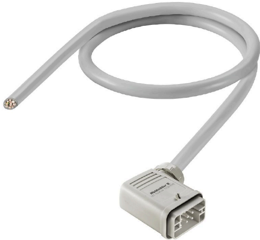
Product similar to illustration