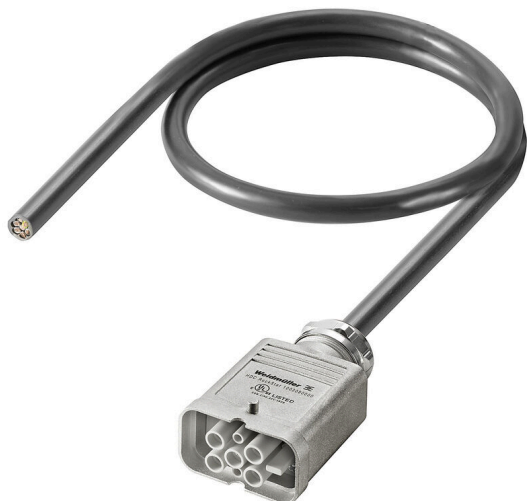
Product similar to illustration