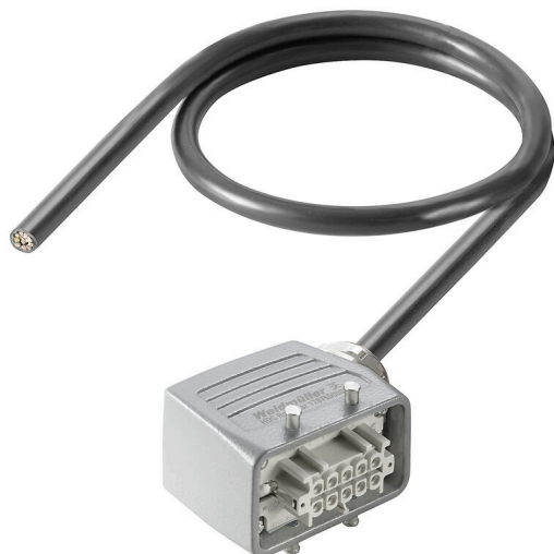
Product similar to illustration