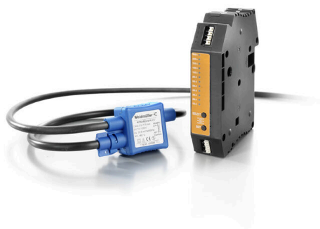
use with Rogowski coil