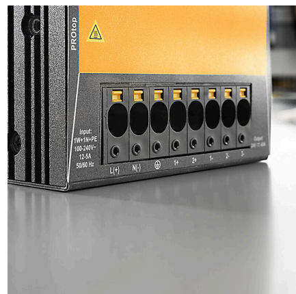
Power up to UL 600 V offset solder pins