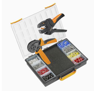
Set di crimpatura