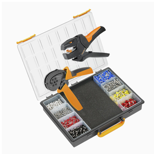
Set di crimpatura