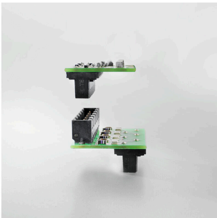
Connection made easySafe board-to-board connection