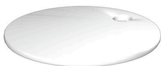
Come da figura