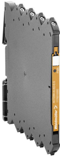
Illustrazione del prodotto, Simile alla figura