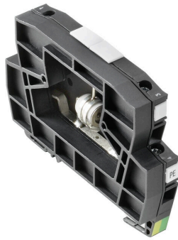
Come da figura