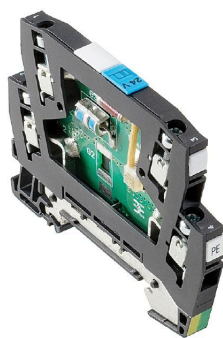
Come da figura