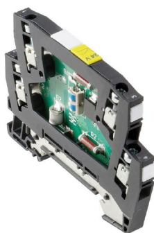
Come da figura