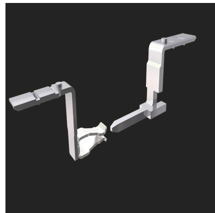
Uncompromising functionality High vibration resistance