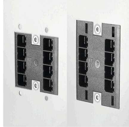
Helyet takarít meg a kártyán