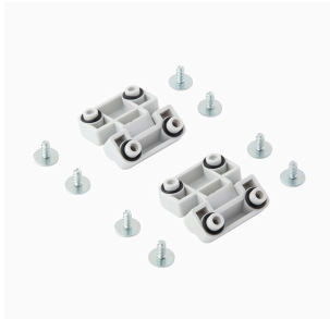
Série MPC, charnières, jeu de 2 pièces