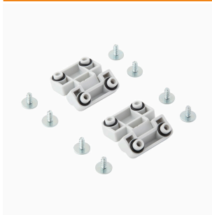
Série MPC, charnières, jeu de 2 pièces