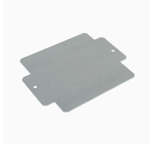
Série Klippon® K, accessoires