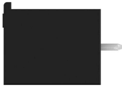
Illustration du produit