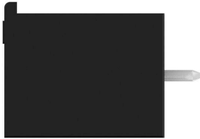
Illustration du produit