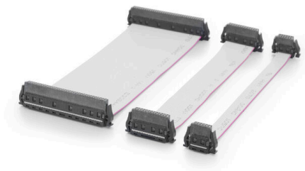
Three standard lengths (0.1 m, 0.2 m, and 0.5 m)