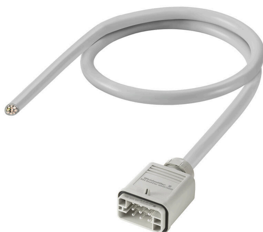
Product similar to illustration