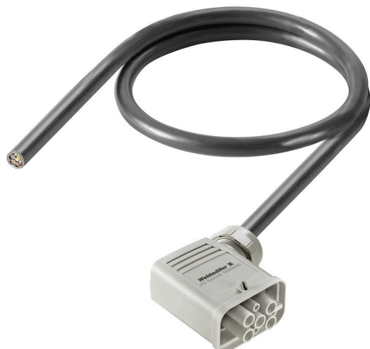
Product similar to illustration