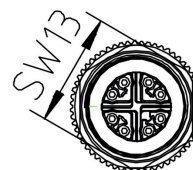
Schéma des pôles