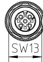
Schéma des pôles