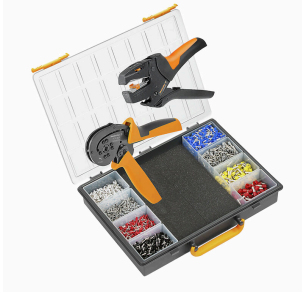
Kits de sertissage