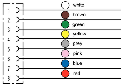
Schéma des pôles