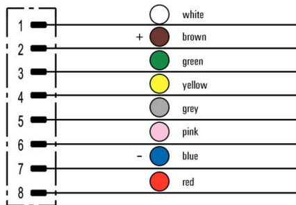
Schéma des pôles