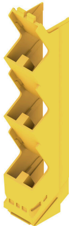
Illustration du produit