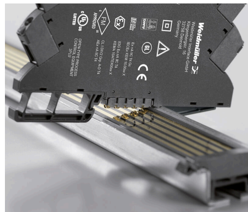
Option d'alimentation électrique supplémentaire via bus