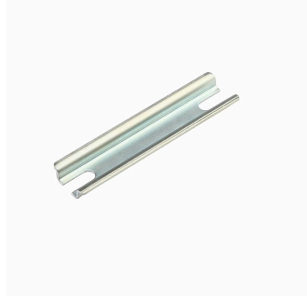
Série Klippon® K, accessoires