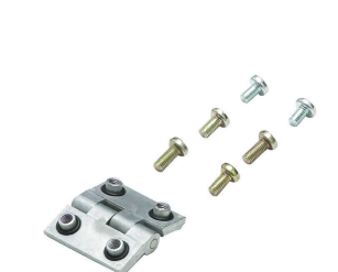
Série Klippon® K, accessoires