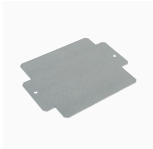
Série Klippon® K, accessoires