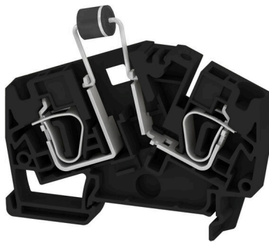
Illustration du produit