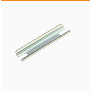
Série Klippon® K, accessoires