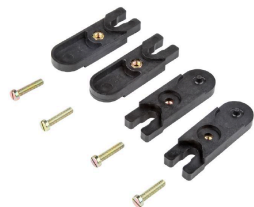
Lengüetas de sujeción exteriores Juego de 4 unidades