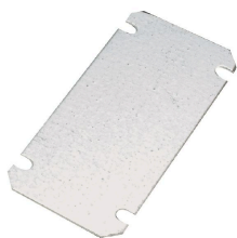
Placas de montaje 1,5 mm chapa de acero, cincado