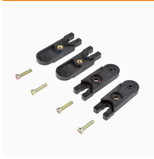
Lengüetas de sujeción exteriores Juego de 4 unidades