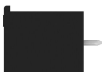
Imagen de producto