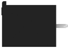
Imagen de producto