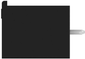
Imagen de producto