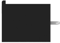
Imagen de producto