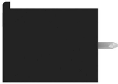
Imagen de producto