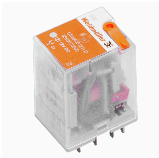
Similar a la ilustración

Relés individuales dentro del CRM CUBESERIES