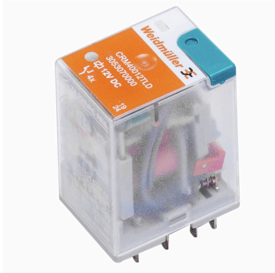
Similar a la ilustración