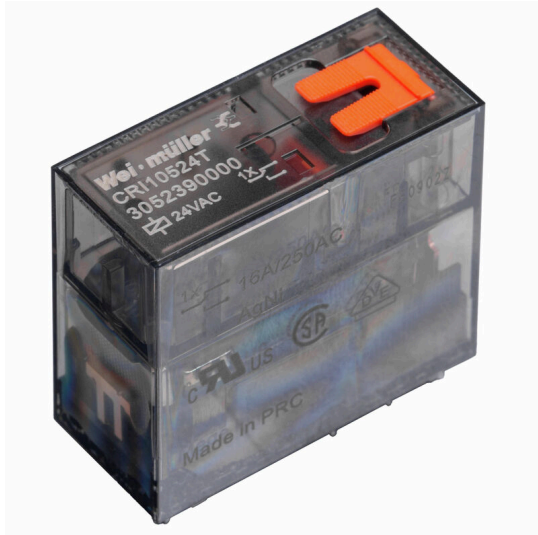
Similar a la ilustración

Relés individuales dentro de la CUBESERIES CRI con botón de prueba Relés individuales dentro de la CUBESERIES CRI