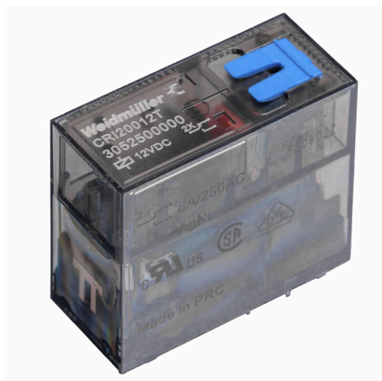
Similar a la ilustración

Relés individuales dentro de la CUBESERIES CRI con botón de prueba Relés individuales dentro de la CUBESERIES CRI