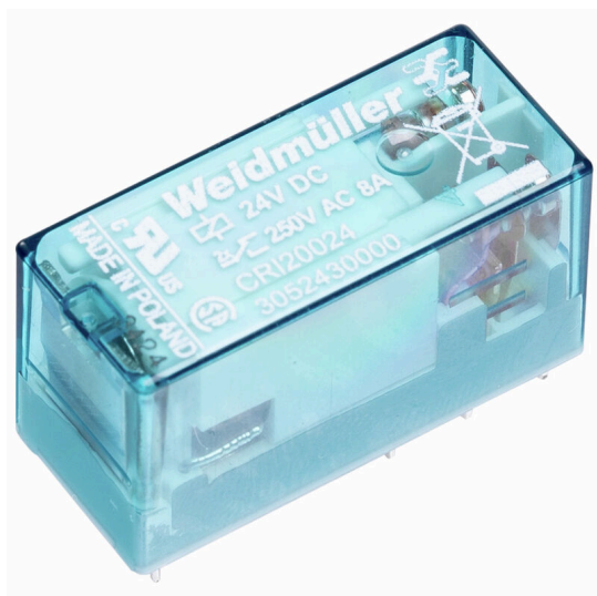
Similar a la ilustración

Relés individuales dentro de CUBESERIES CRI